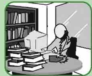
REVISOR CON RECURSO